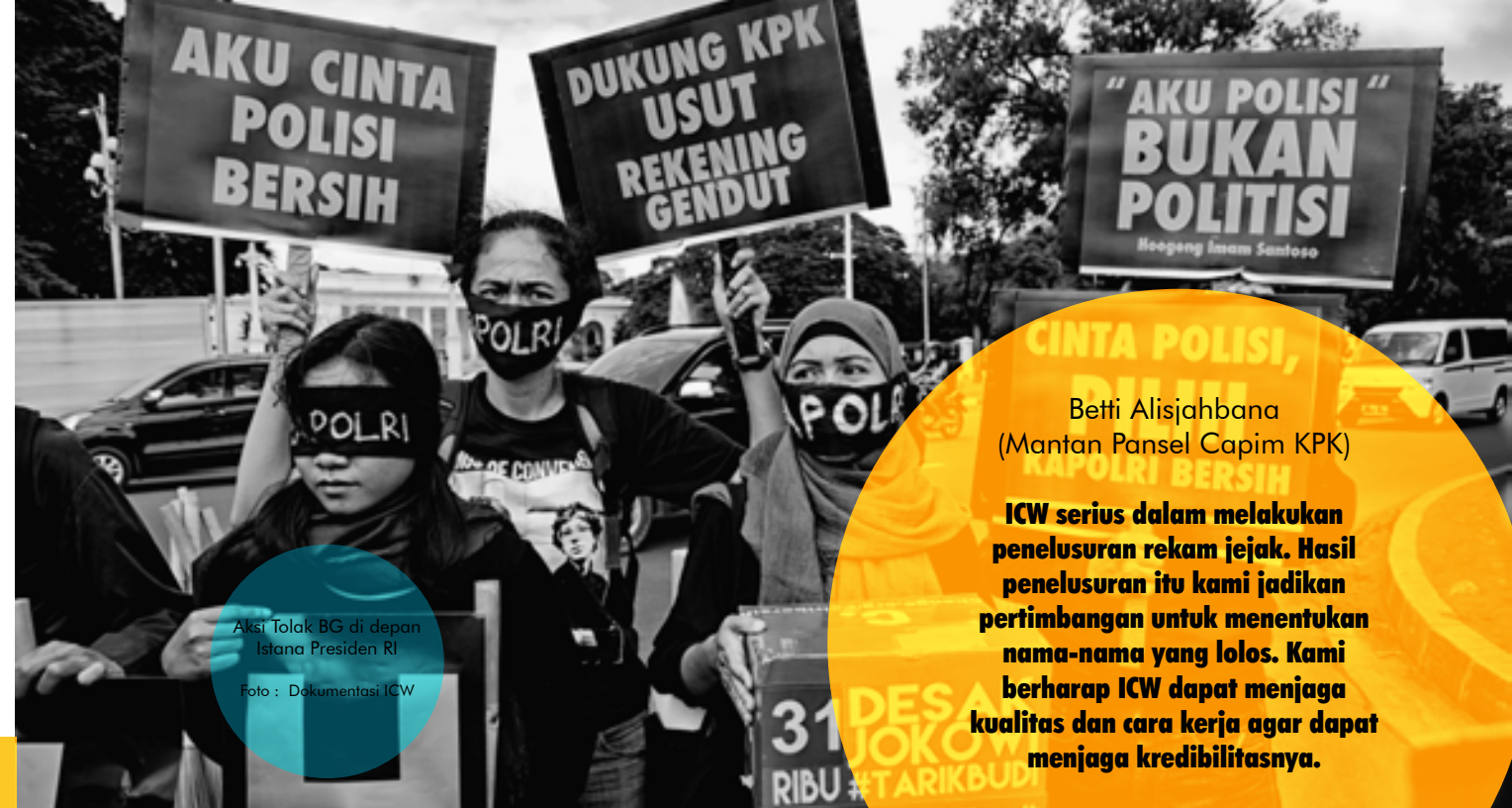
Aksi Tolak BG di depan Istana Presiden RI

Panel KPK sempat khawatir karena sedikitnya pendaftar. Pendaftaran pun