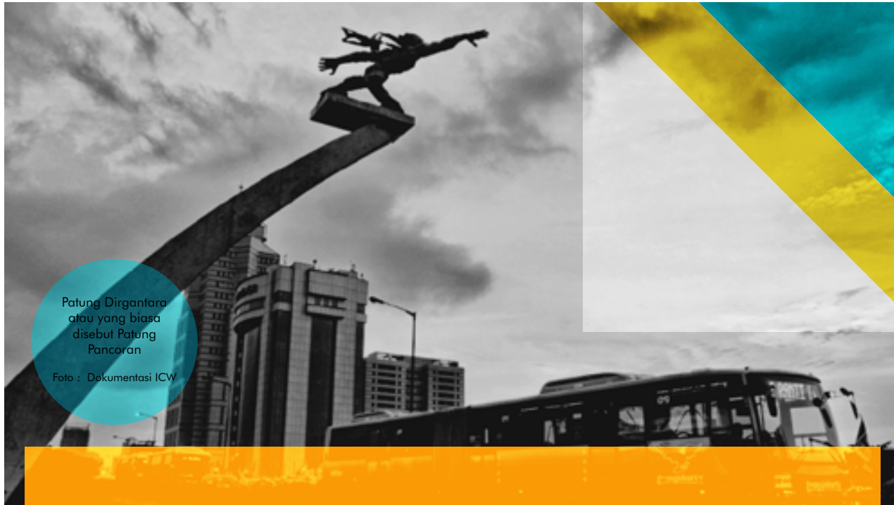
Patung Dirgantara atau yang biasa disebut Patung Pancoran