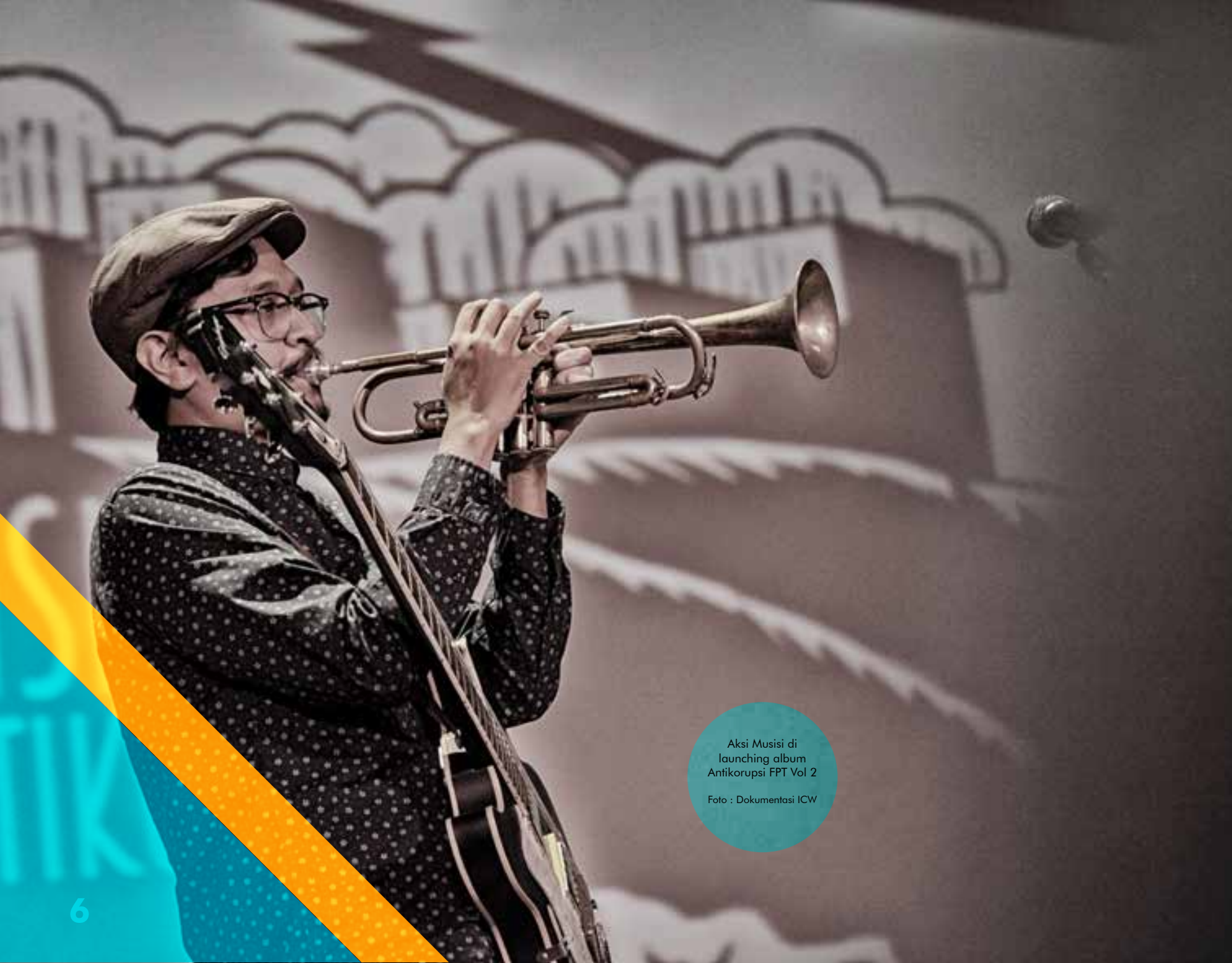
Aksi Musisi di launching album Antikorupsi FPT Vol 2