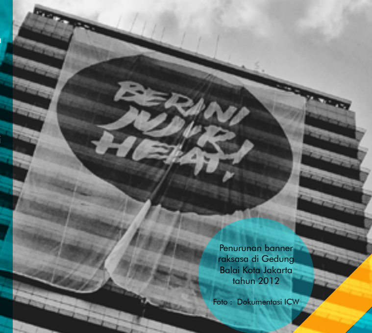
Penurunan banner raksasa di Gedung Balai Kota Jakarta tahun 2012

Demikian halnya hasil kegiatan koordinasi, supervisi dan pencegahan (KORSUPGAH) yang dilakukan oleh KPK, BPK dan BPKP yang dimulai sejak tahun 2012 menemukan indikasi banyaknya anggaran siluman dalam APBD DKI Jakarta. Modus yang sering muncul adalah anggaran atau kegiatan yang tidak diusulkan oleh Dinas (SKPD) tetapi muncul dalam daftar pelaksanaan anggaran yang disahkan.