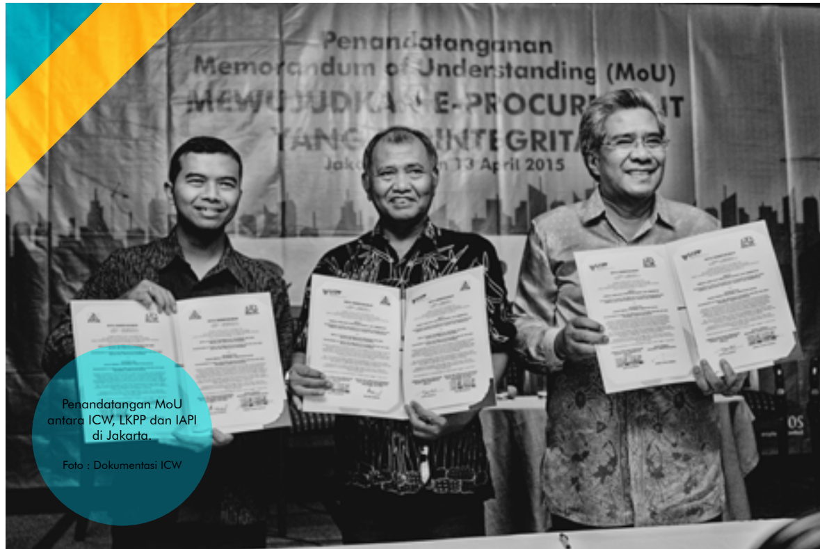
Penandatanganan MoU antara ICW, LKPP dan IAPI di Jakarta.