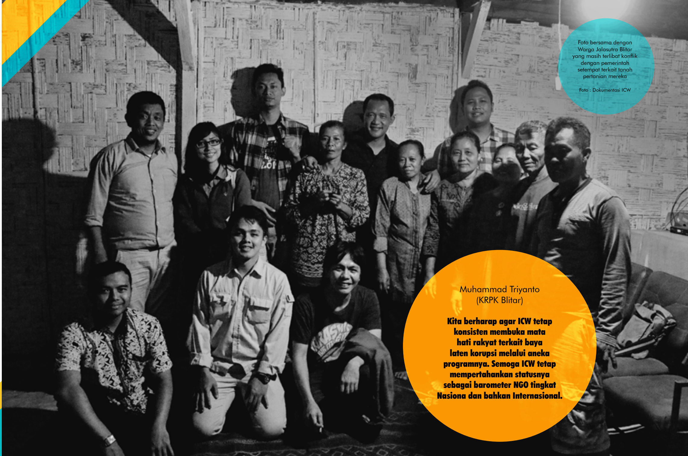
Foto bersama dengan Warga Jelasutra Blitar yang masih terlibat konflik dengan pemerintah setempat terkait tanah pertanian mereka

Oleh karena itu, ICW memfasilitasi proses konsolidasi simpul-simpul jaringan antikorupsi di setiap daerah. Salah satu contohnya adalah di Jawa Timur, bersama Malang Corruption Watch (MCW) dan Komite Rakyat Pemberantas Korupsi (KRPK) Blitar berupaya memperluas jaringan ke Surabaya, Sidoarjo, Madiun, Kediri, Lamongan, dan berbagai daerah lain di Jawa Timur.